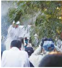
▲湯立ての神事

神楽は、神に歌や踊りを奉納し、豊作や厄除けを祈る日本の伝統行事です。村上の神楽は七百餘所神社で毎年1月15日と10月9日に行われ、恵比寿やアメノウズメなどが登場する出雲地方に由来する九座の舞が伝わっています。