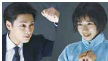
配給:ワーナー・ブラザーズ映画