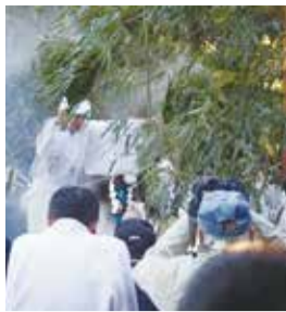
▲湯立ての神事

神楽は、神に歌や踊りを奉納し、豊作や厄除けを祈る日本の伝統行事です。村上の神楽は七百餘所神社で毎年1月15日と10月9日に行われ、恵比寿やアメノウズメなどが登場する出雲地方に由来する九座の舞が伝わっています。