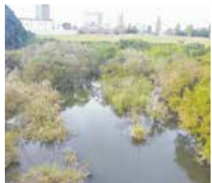
ニュータウン大橋の下に広がる調整池の自然