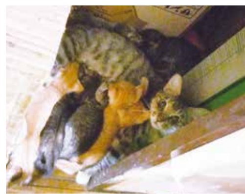
▲同居高齢者の家での多頭飼育崩壊 子猫が7匹いる

便利な譲渡システム 譲渡会にいた犬は中型犬や大型犬が多く(子犬は家でのお見合いのみ対応)、猫はむっちりとしたキジトラと黒白の子が多かったです。ポチたま会で保護している子はホームページの一覧で確認でき、会員のブログで現在の状態を見ることが出来ます。お問合せから希望する犬猫のタイプなどを伝えれば、お勧めの犬猫を紹介することも可能です。