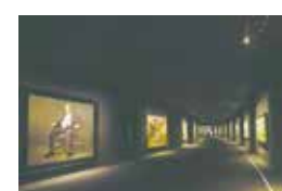
「私の代表作展」展示会場 ギャラリー8

写実絵画を専門に扱うホキ美術館には、3年ごとに展示替えを行う特別な展示室があります。ここで展示されるのは作家自身に「自分の代表作」になるような作品を描いてほしい、とホキ美術館から依頼した作品たち。今回は第5回目の「私の代表作」の展示替えとなり、初公開となる100号以上の大作が並びます。自身の「代表作」に挑戦する作家たちの渾身の新作をどうぞお楽しみください。