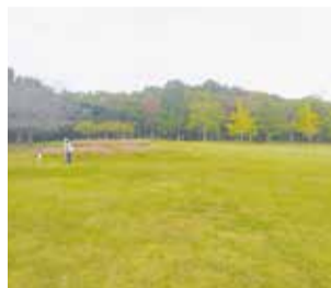
広大な芝生広場(Bゾーン)