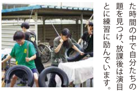
▲放課後タイヤで練習する姿

鼓組は現在41人で構成されており、普段は近隣のお祭りやイベントなどで演奏を披露しています。高校で初めてバチを握ったという子どもも多く入部するそうです。毎年多く入部するそうです。全国大会にも出場経験があることからファンも多く、毎年6月に八千代市市民会館で開催される自主公演には多くの観客が訪れます。