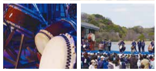
▲代々受け継がれてきた太鼓で演奏